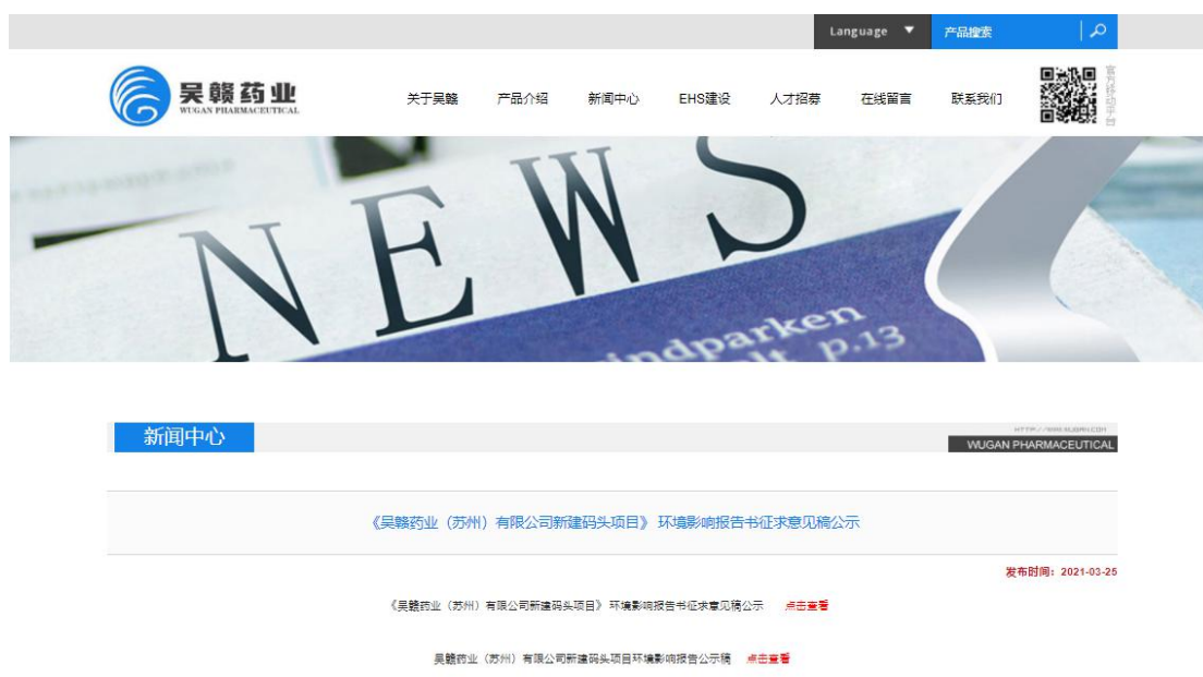
图 3-1 环评报告书征求意见稿网络公示