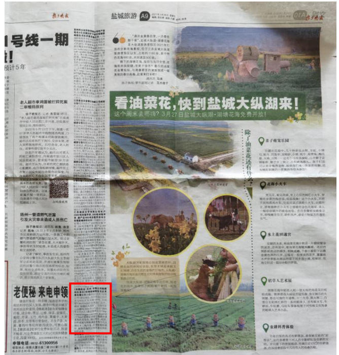
图 3-2 征求意见稿第一次公示（2021 年 3 月 26 日）