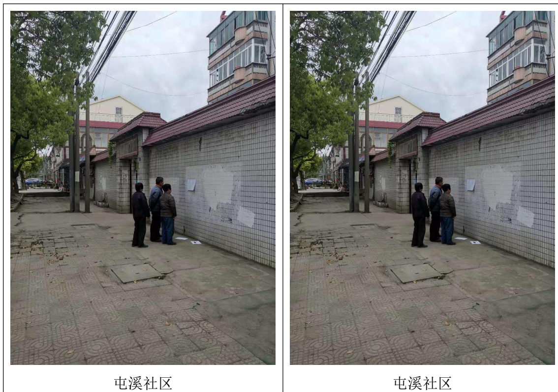
图 3-4 张贴公告的现场照片