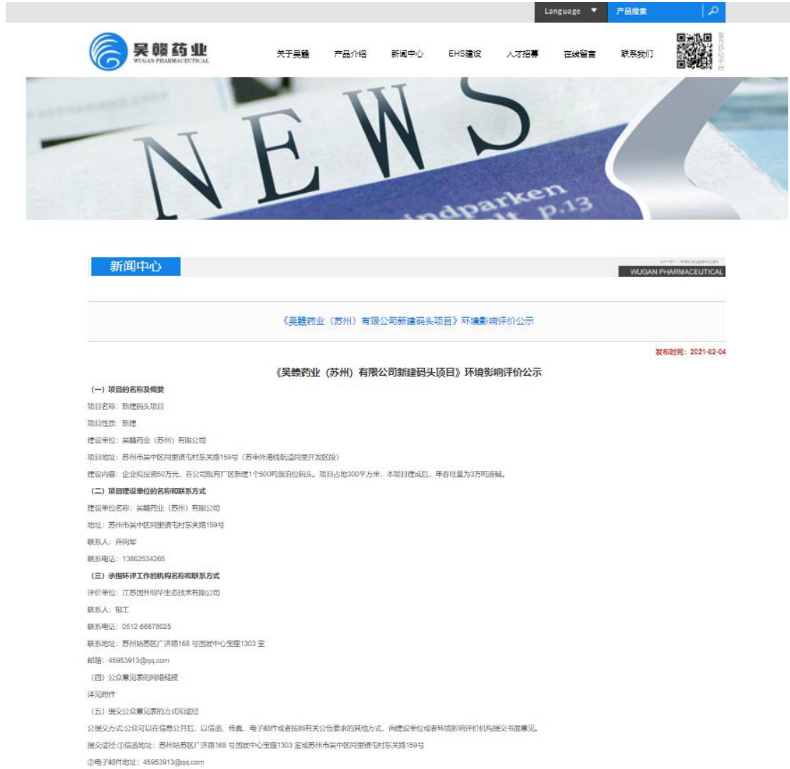
图 2-1 首次网络公示截图